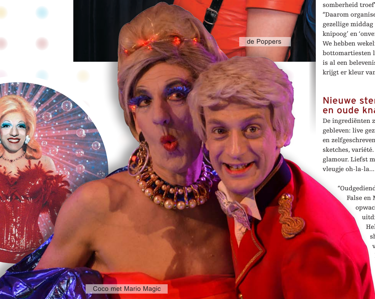
Coco met Mario Magic